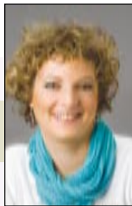
מאת: אסנת סדן

כספית - התוכנה הקלה והמשתלמת להנהלת חשבונות www.casplit.biz