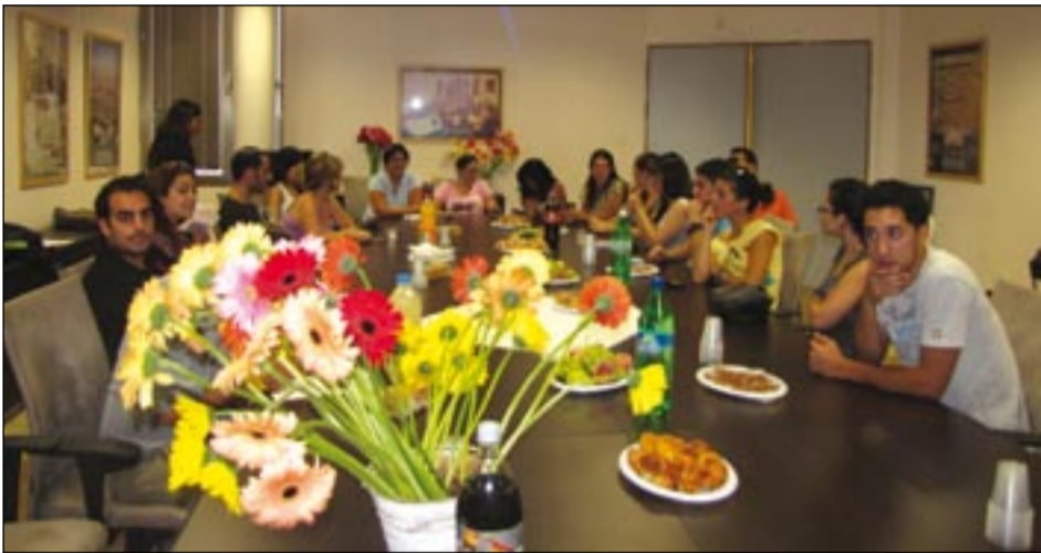
בתום הברכות והתודות, הזמין ראש המועצה את הסטודנטים לקבל מלגה ופרח ואמר שישמח לפגוש אותם גם בשנה הבאה.

טקס הענקת מלגות מטעם המועצה לסטודנטים שחנכו במסגרת פר"ח בלב השרון