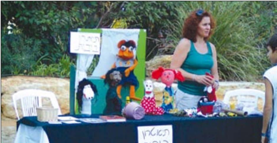
זוכן החוג לתיאטרון בובות, סמגון החוגים המוצעים