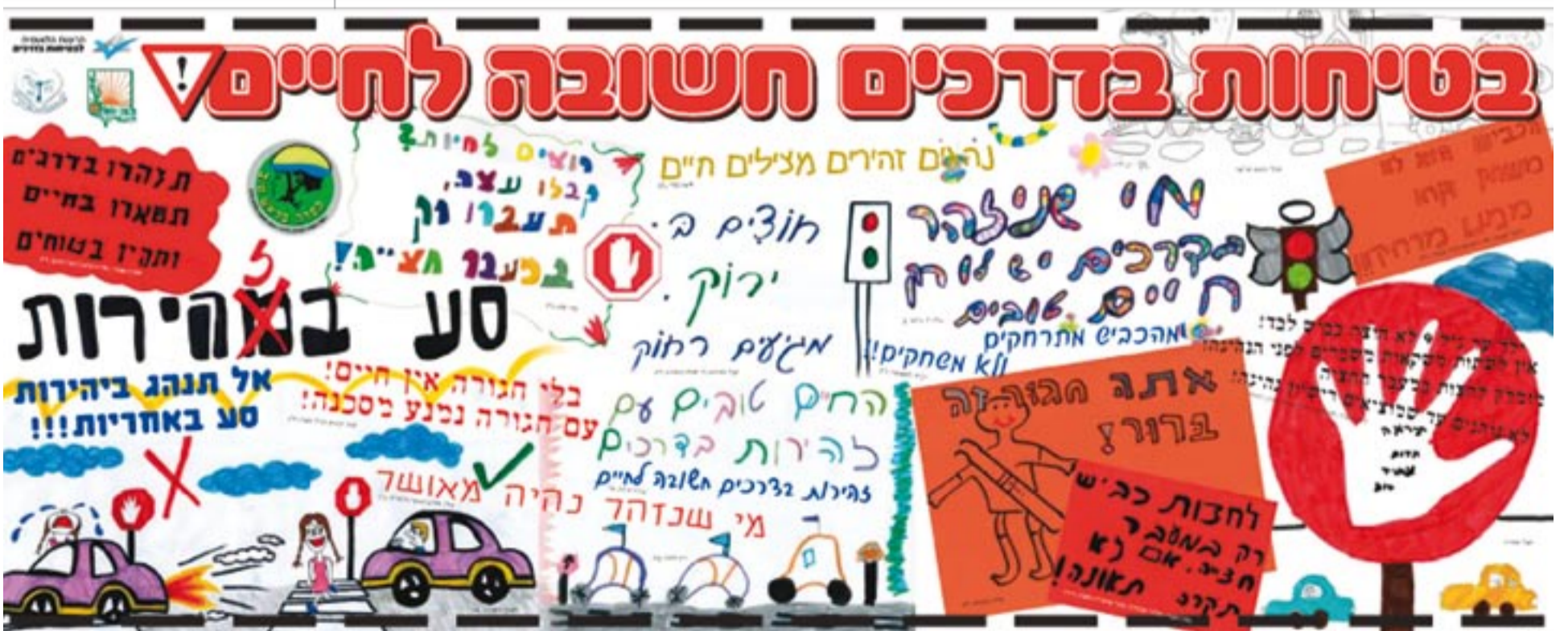
כרזה זהירות בדרכים שעצבו תלמידי "בכר רוסו" והוצבה במתחם בית הספר

אנא, צור/צרי קשר טלפוני עם: מרים אלישע - רכזת פו"ש בלב השרון טלפון: 054-4723125