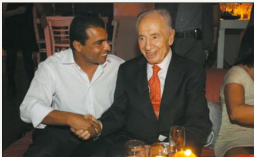
עם נשיא המדינה שמעון פרס במסיבת הבר המצווה של בנו של המשנה לראש הממשלה סילבן שלום

במדור זה נציג את חברי המליאה. והפעם: ארנון מינס מתנובות