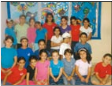
ממשתתפי קייטנת הקיץ