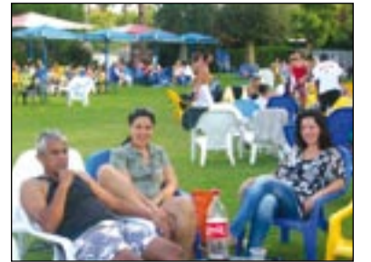
מסיבת קיץ בצור משה