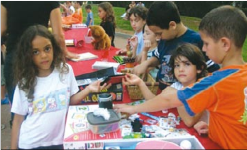
תני ארנק, קחי ספר