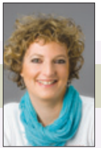
מאת: אסנת סדן

כספית - התוכנה הקלה והמשתלמת להנהלת חשבונות www.caspit.biz