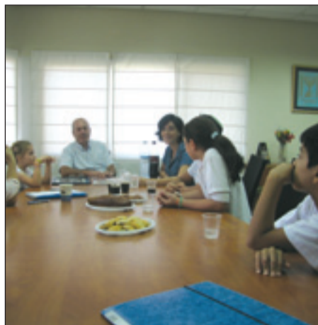
פראינים את ראש המועצה

בכתות. לצורך כך, נרכשו לכל כיתה מחשב, מקרן, מסך ברקו וחבור לאינטרנט, והמורה תיעזר בציוד כדי להעשיר את הלמידה. התלמידים לא יצטרכו יותר