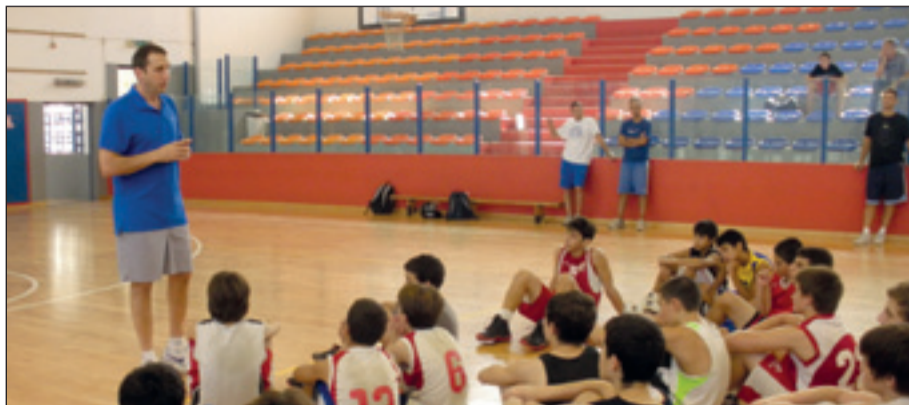
מתאמנים עם דייויד בלאט