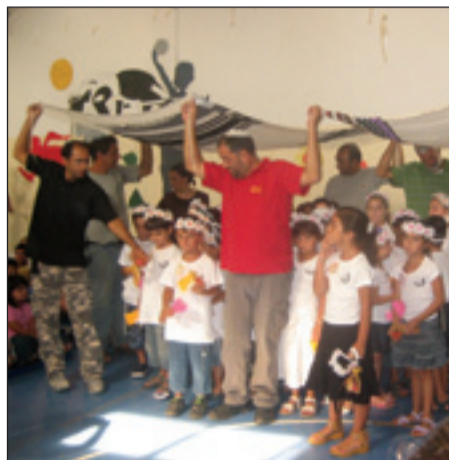
שלום כיתה א'