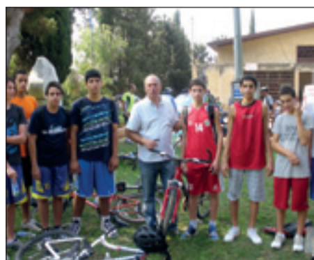
חניכי הפועל לב השרון - יודעים גם לדווש