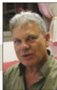
מאת: אורנה הדס

דורון גרין מצור משה: בכלל לא ידעתי שאני יכול לכתוב ככה