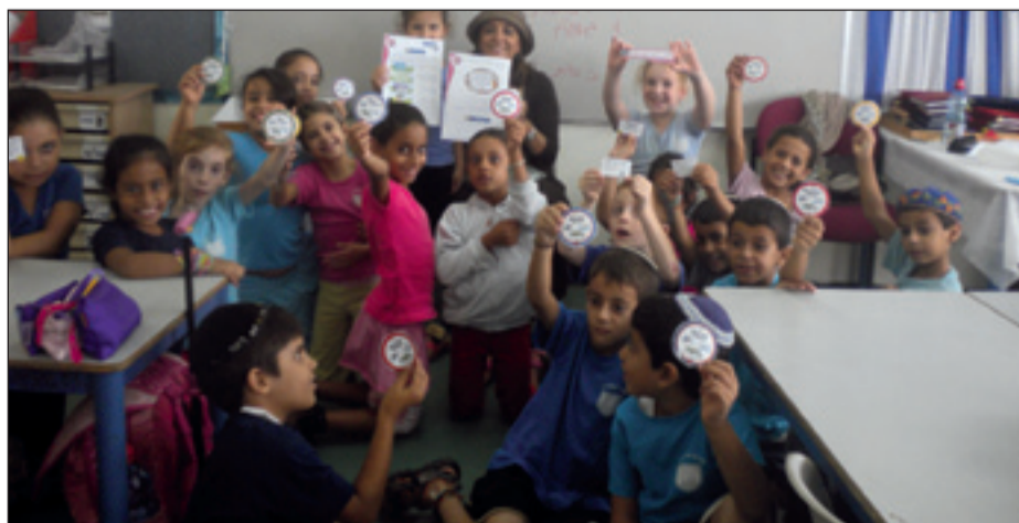
כיתה ב' - תפקיד לכל תלמיד בסגרת שיעורי חינוך מתוך אמונה ומפתח הלב

בית-ספר "אור השרון" בחר להשתתף בפרויקט "שגרירי מידות וחברה", בשיתוף מתנאל, במסגרת תוכנית "חינוך מתוך אמונה ומפתח הלב".