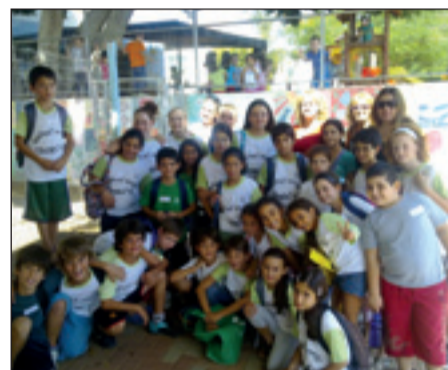
פרלמנט בכר רוסו

כתבה וליקטה: מיקי פניני - יו"ר פרלמנט ביה"ס