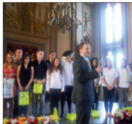
הנסיך עם התלמידים

התלמידים יצרו קשרי חברות חדשים ואמיצים ושמורים על קשר עם כל המשתתפים בסדנה, כפי שעשו גם משתתפיה בשנה שעברה, שמלבד קשר