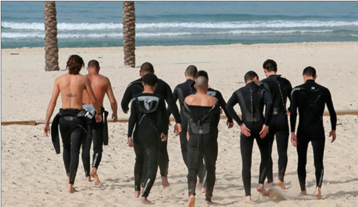
נערי אבן דרך בפעילות אתגרית