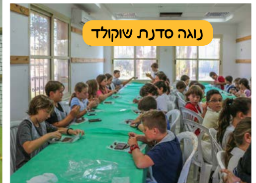
נוגה סדנת שוקולד