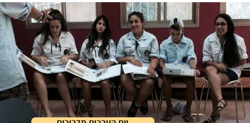
יום הערכות מדריכים