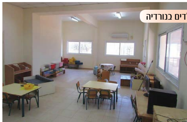
שיפוץ גני הילדים בנורדיה