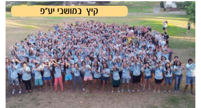
קיץ במושבי יע"פ

גם השנה יצאו חניכי בני עקיבא במושבי יע"פ למחנות השונים של התנועה. תנועת בני עקיבא מוציאה מידי שנה 6 מחנות שונים ע"פ השבטים השונים.