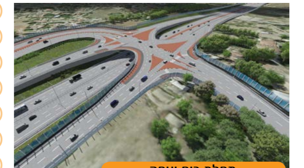
מחלף בית יצחק