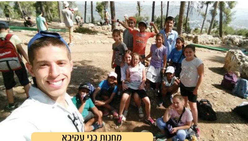
מחנות בני עקיבא

חשוב לציין שלמרות עומס החום הכבד שהיה בתקופת המחנות התנועה מול חדר מצב נערכו וערכו שינויים רבים בתוכנית המחנות על מנת שהחניכים יקבלו את המענה. החניכים נהנו מאוד במחנות וכבר מחכים למחנה הבא.