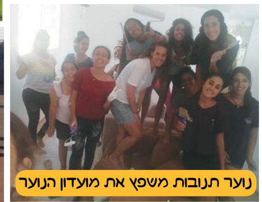
נוער תנובות משפץ את מועדון הנוער