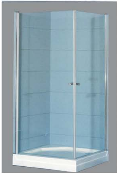
מקלחון 2 דלתות זכוכית 6 מ"מ

שקוף/פסים/גרניט 80/80 - 500 ₪ 90/90 - 550 ₪