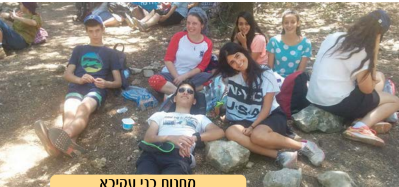
מחנות בני עקיבא

אנן מאחלים להם הצלחה רבה ושתהיה שנה טובה!