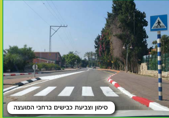
סימון וצביעת כבישים ברחבי המועצה