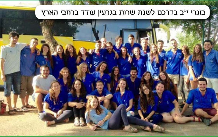
בוגרי י"ב בדרכם לשנת שרות בגרעין עודד ברחבי הארץ