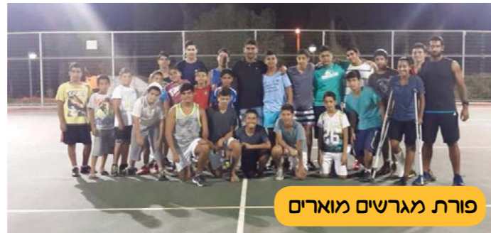
פורת מגרשים מוארים