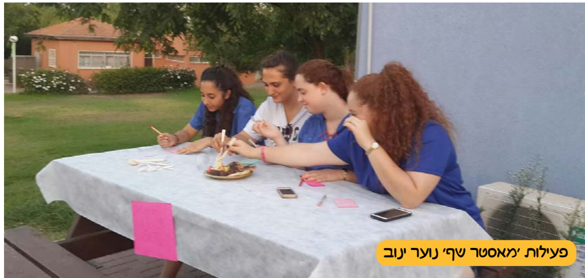
פעילות 'מאסטר שף' נוער ינוב