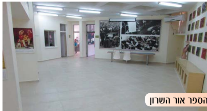
שיפוץ בית-הספר אור השרון