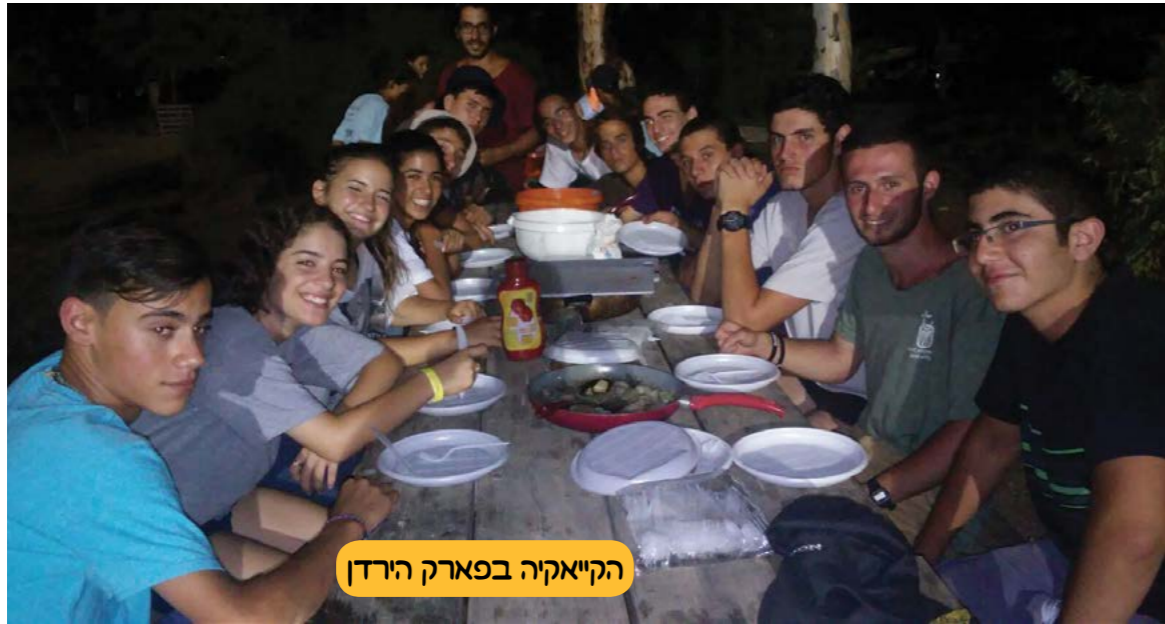
הקייאקיה בפארק הירדן