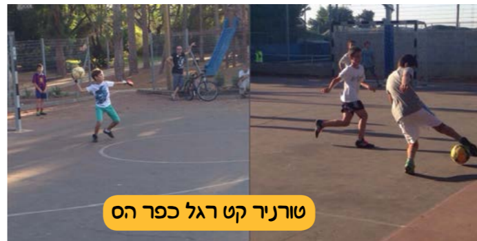
טורניר קט רגל כפר הס