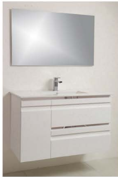
ארון אמבט +מראה +כיור

שקוף/פסים/גרניט 80/80 - 500 ₪ 90/90 - 550 ₪