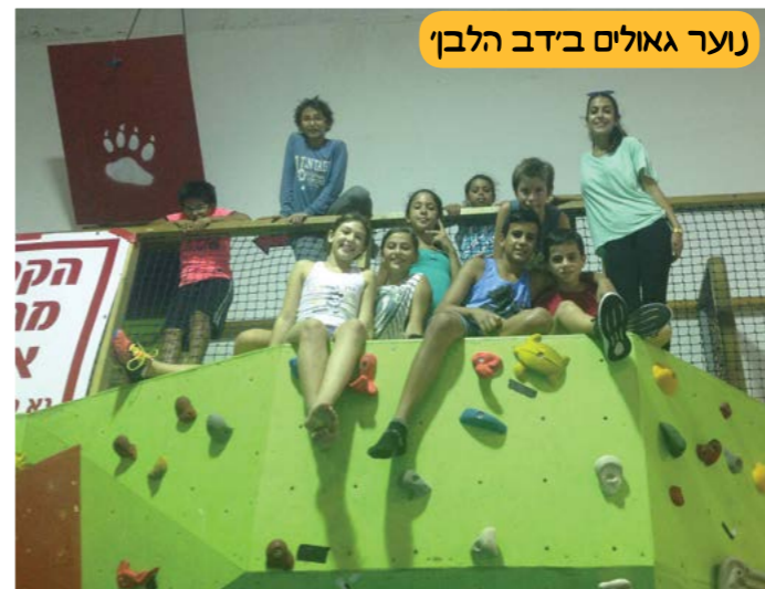
נוער גאולים בידב הלבן