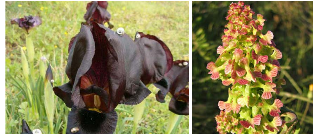
חומעת האווירון ואירוס הארגמן שהוחזרו לחלקות החקלאיות

נטיפה יחד עם איגוד ערים סכנין. המיזמים ברשויות הללו הותאמו למאפיינים המקומיים הייחודיים לו. השלב הבא הינו הרחבת השיקום בשטחים הפתוחים, מוגש יחסית חדש אך מחייבת כנגד הפיתוח ותהליך העיור. "המטרה היא ששמירה על שטח משוקם תדרוש מינימום תחזוקה ובכך טמון המפתח להצלחה לטווח ארוך"