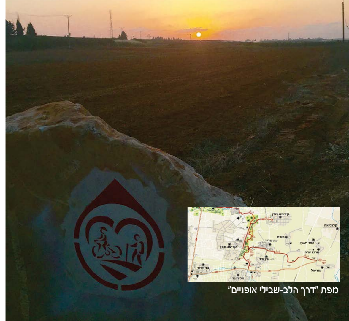
מפת "דרך הלב-שבילי אופניים"

דרך הלב מערכת שבילים המיועדים לרוכבי אופניים ולהולכי רגל שמחברים בין הישובים במועצה. השנה המועצה ביצעה קטע נוסף שמחבר מפארק בריכת החורף הנמצא בסמוך ליער עין שריד ולעין ורד. בהמשכו של השביל מושב פורת, דרך המוביל, כפר יעבץ, ומסתיים ביעף. ישנם סימונים לאורך השביל ובכניסות לישובים שכוללים שלטי מבואה גדולים עם הסברים על הסימונים השונים, כללים והוראות בטיחות. מצורפת מפת שבילים שכוללת את שני המקטעים שסומנו. בקשה מיוחדת לא להיכנס לשטחים החקלאיים. וסעו בזהירות.